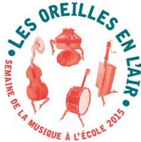
Logo de l'événement

Dans toute la France, des événements musicaux réalisés avec la complicité des Musiciens Intervenants : concerts, portes ouvertes, expositions, conférences, rencontres, stages